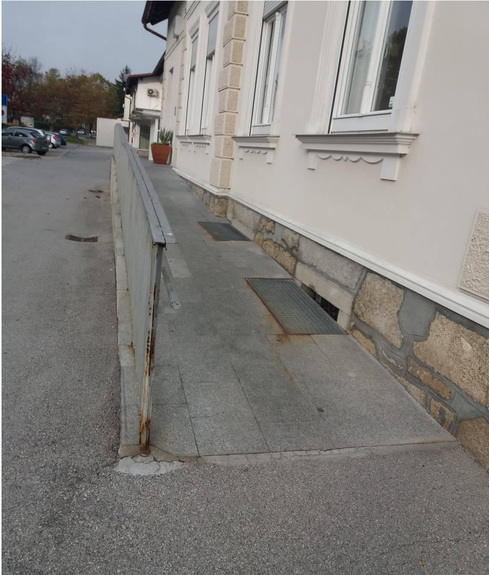
Slika 1: Dostopnost lekarne