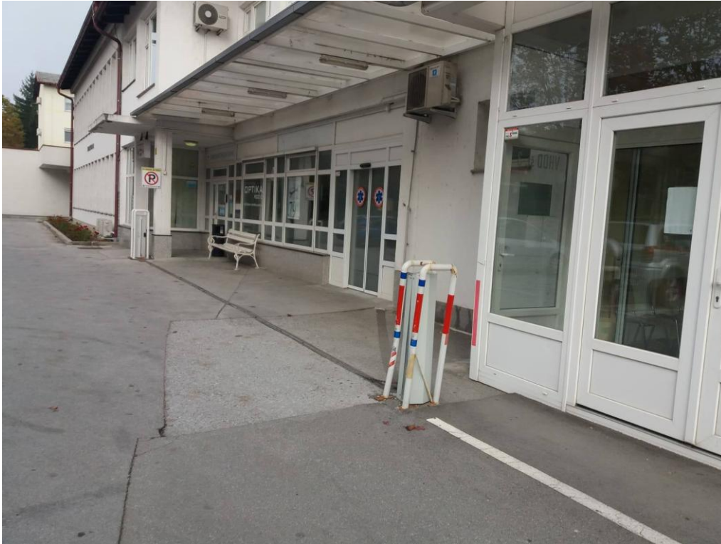
Slika 3: Dostopnost zdravstvenega doma