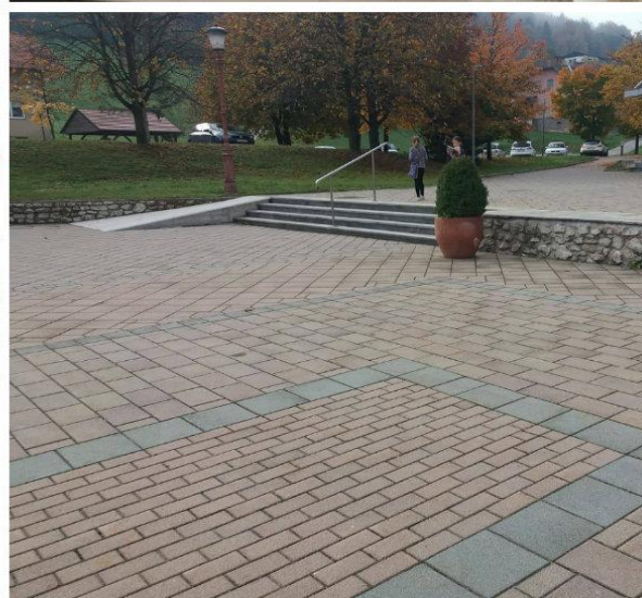
Slika 2: Dostopnost knjižnice oziroma kulturnega doma