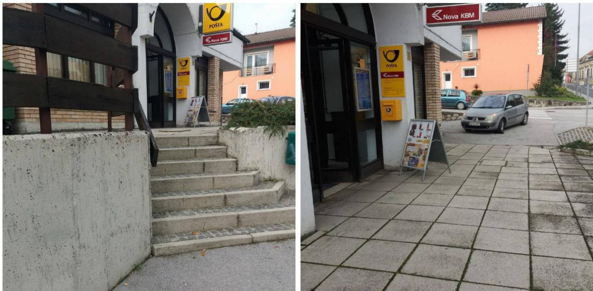
Slika 4: Navidezna dostopnost pri vstopu na pošto

Kot prikazuje zgornja slika območja pri pošti, pa obstajajo tudi kraji, ki so dostopni z ene strani, ampak ko pogledamo malo bolje, ugotovimo, da nekdo, ki je na vozičku, dejansko ne more dostopati s strani, ki naj bi bila dostopna, saj so tam vedno avtomobili, če jih ni, pa še vedno obstaja možnost, da nekdo na hitro zapelje v ta prostor in je to območje kvečjemu