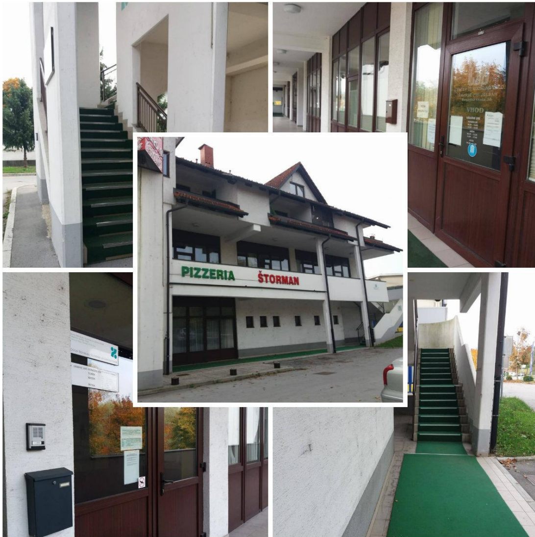
Slika 6: Nedostopnost CSD in Zavoda za zaposlovanje

Nad bivšo picerijo Štorman se nahajata CSD in Zavod za zaposlovanje, do koder lahko uporabniki dostopamo samo po strmih stopnicah. Ni dvigala, tako da resnično ne vem, kako lahko hendikepirani v teh institucijah karkoli uredijo. V bistvu odgovor že imam – zanje zadeve urejajo drugi.