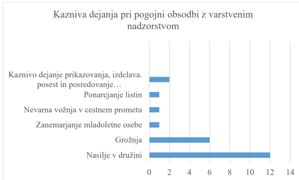
Graf 4.1: Število izrečenih varstvenih nadzorstev po kaznivih dejanjih pri pogojni obsodbi

Zanimalo me je, pri katerih kaznivih dejanjih se sodišča odločajo za izrek pogojne obsodbe z varstvenim nadzorstvom. Iz spisov je mogoče razbrati, da je večina kaznivih dejanj, za katera je sodišče določilo pogojno obsodbo z varstvenim nadzorstvom, povezana z nasiljem. V največ primerih (kar 12) gre za kaznivo dejanje nasilja v družini po 135. členu KZ, za kazniva dejanja grožnje po 135. členu KZ, ki so se prav tako dogajala v partnerskih odnosih (6 primerov), in za kaznivo dejanje zanemarjanje mladoletne osebe po 192. členu KZ. Sodišče je pogojno obsodbo z varstvenim nadzorstvom izreklo v posameznih primerih še za kazniva dejanja nevarne vožnje v cestnem prometu po 324. členu, ponarejanje listin po 251. členu in za kaznivo dejanje prikazovanja, izdelave, posesti in posredovanja pornografskega gradiva po 176. členu KZ.